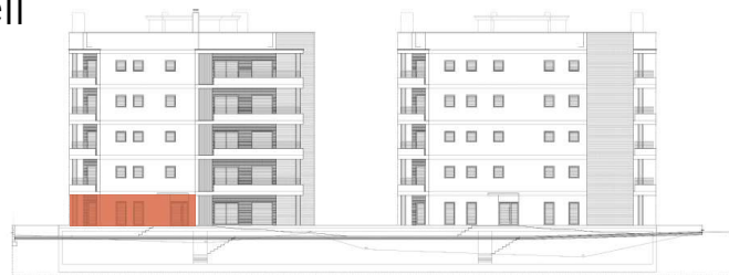
EDIFICIO B Vista paso interior EDIFICIO A