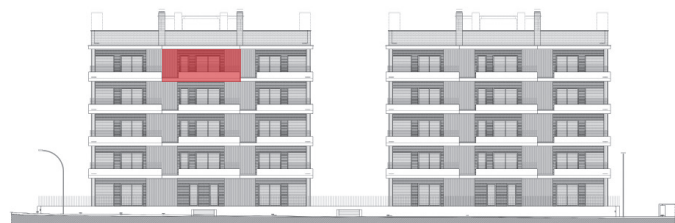
C/ Mercè Rodoreda EDIFICIO A EDIFICIO B