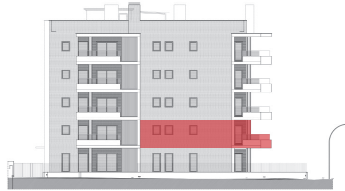
Av. de la Cossetània EDIFICIO A