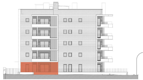
Av. de la Cossetània EDIFICIO A